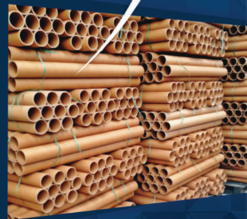
USO INDUSTRIAL Uso industrial Industrial use