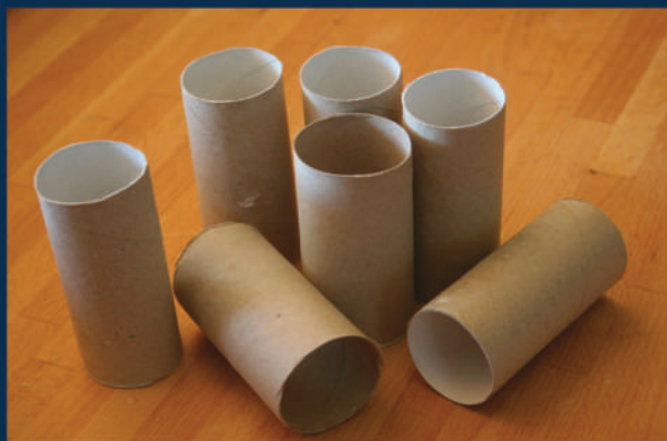
TUBOS PARA EMBALAJES Tubos para embalagens Paper tube for packaging