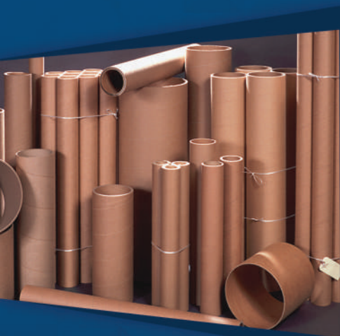
TUBOS PARA PAPEL Tubes for paper